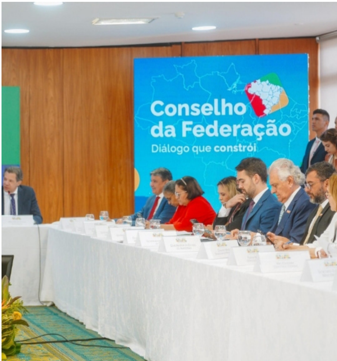
Governador Ronaldo Caiado durante terceira reunião ordinária do Conselho da Federação, em Brasília