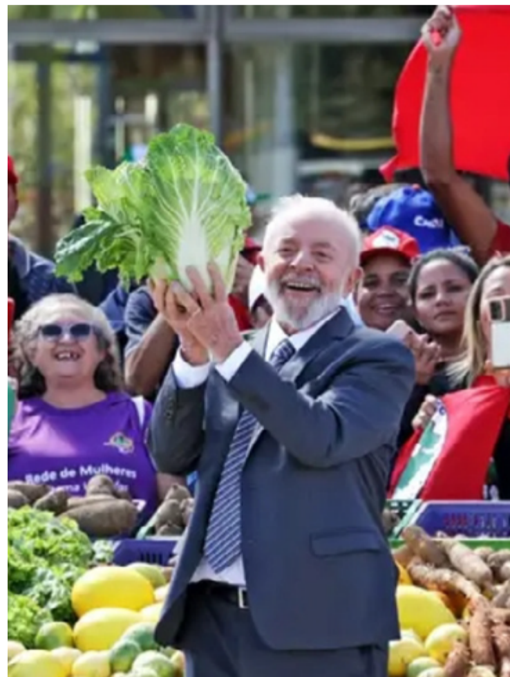
Presidente Luiz Inácio Lula da Silva anuncia Plano Safra da Agricultura

Valor é 6,2% superior ao anunciado na safra passada e o maior da série histórica. Volume total investido chega a R$ 85,7 bilhões