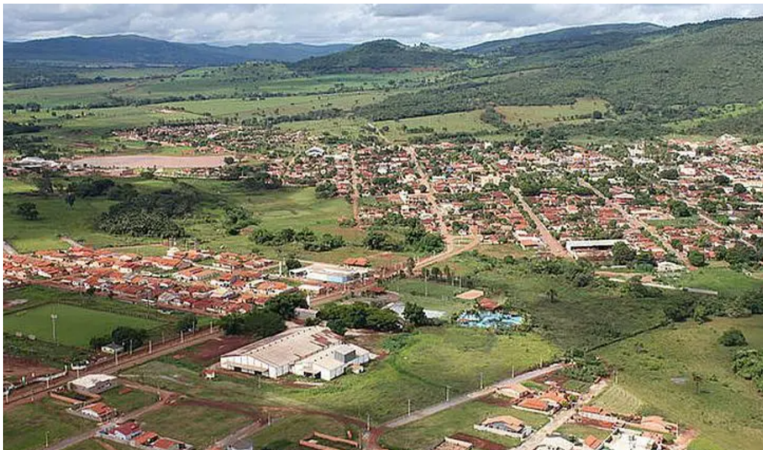
Instalação do complexo fotovoltaico na zona rural do município Vila Propício, ocupará uma área próxima da cidade Barro Alto, situada na região do Vale do São Patrício

O estado ocupa a 7ª posição no ranking nacional da energia solar, ultrapassando a marca de 1,3 GW de capacidade instalada em energia solar, em geração distribuída. A emissão da autorização contou com o suporte da Secretaria-Geral de Governo, em atuação com a Secretaria de Meio Ambiente e Desenvolvimento Sustentável.