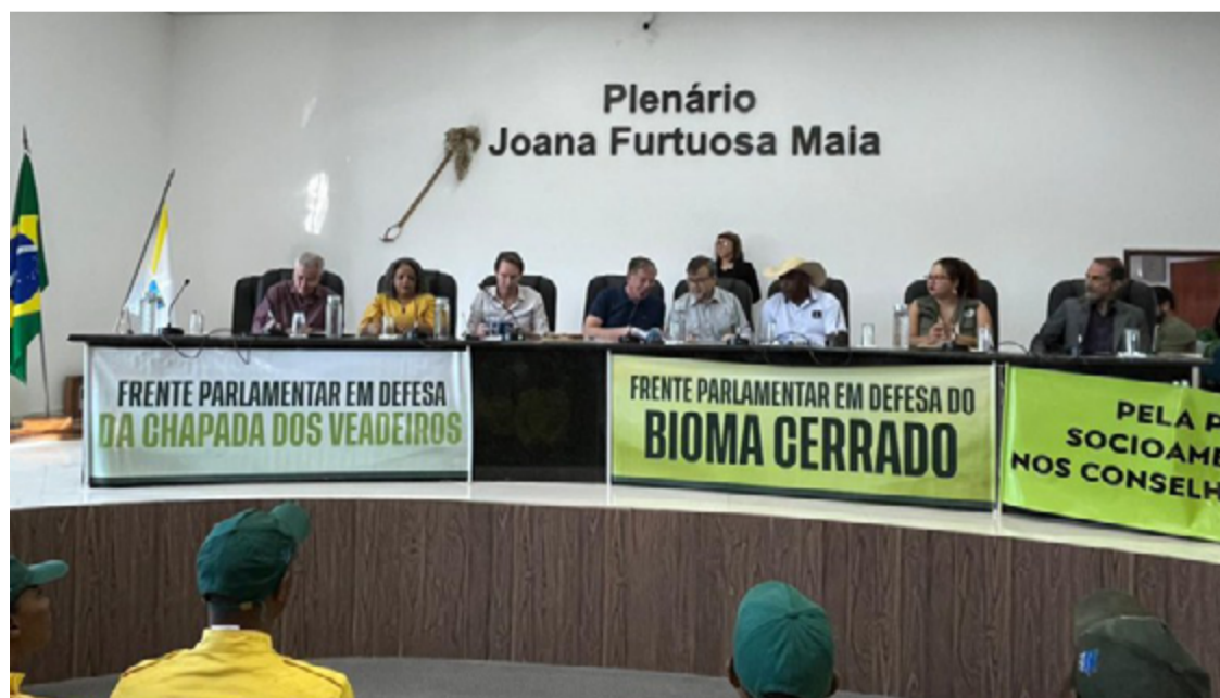
A ação contou com a participação de equipes da Equatorial, do Grupo de Repressão a Crimes Patrimoniais de Luziânia (GEPATRI) e da Delegacia de Cristalina (5ª DRP)

cou a relevância desses projetos para garantir o desenvolvimento sustentável das comunidades, gerar renda e negócios, enquanto se preserva o bioma do cerrado. “Sabemos da importância desses projetos para que a gente