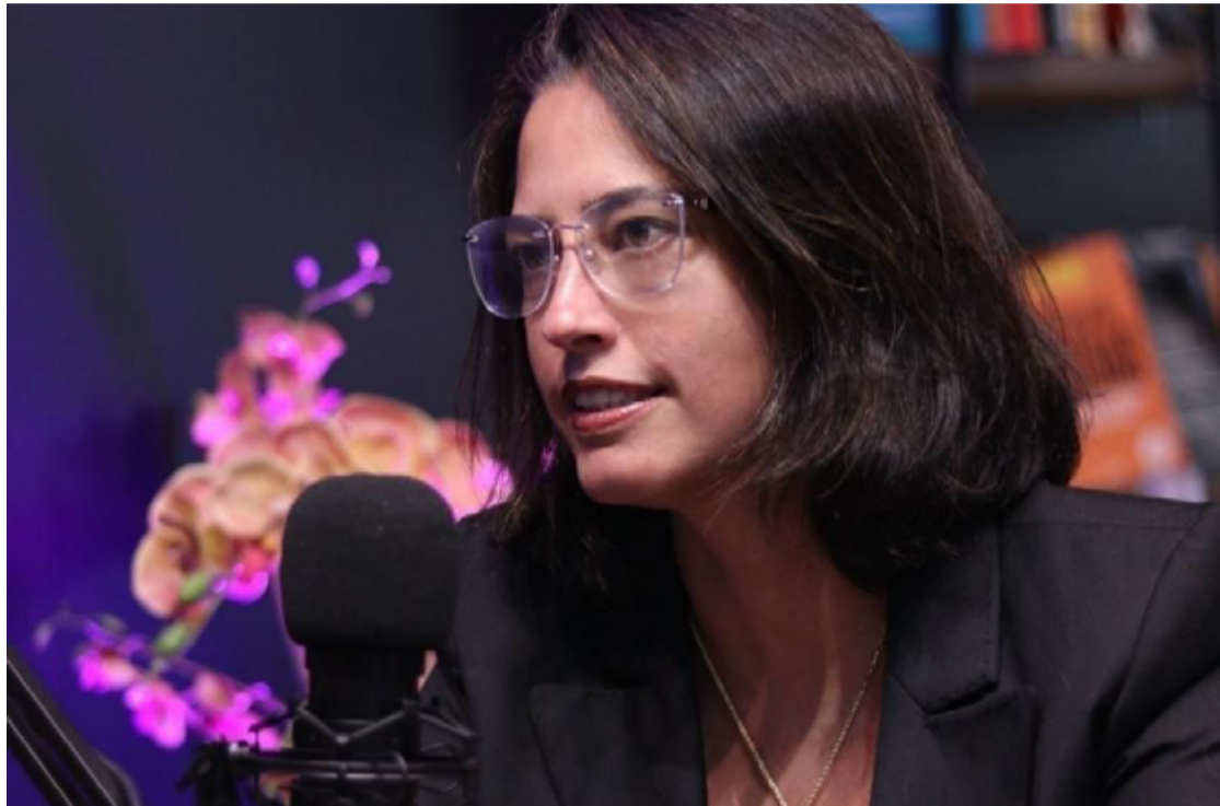
O objetivo é alcançar a população de mais de 1,5 milhão de habitantes da região metropolitana