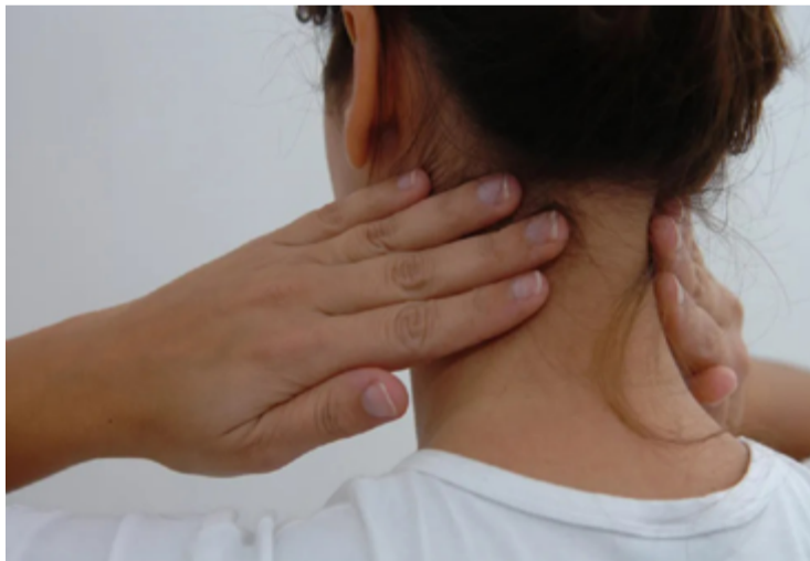
Dados do Instituto Nacional de Câncer (Inca) apontam ainda que esses tumores são responsáveis por pelo menos 10 mil mortes anualmente no Brasil

Em virtude dos dados alarmantes, a Sociedade Brasileira de Cirurgia de Cabeça e Pescoço (SBCCP) criou a campanha “Julho Verde”, buscando promover o reconhecimento de sintomas para diagnóstico e prevenção desse tipo de tumor. É importante ressaltar que, quando diagnosticado precocemente, as chances de cura são de 90%, número que cai para 40% em estágios avan-