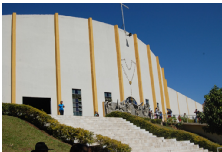
Romaria do Muquém, em Niquelândia

O desejo de conhecer novos lugares, mergulhar na cultura católica ou realizar o sonho de entrar naquele templo que transmite paz, são a base