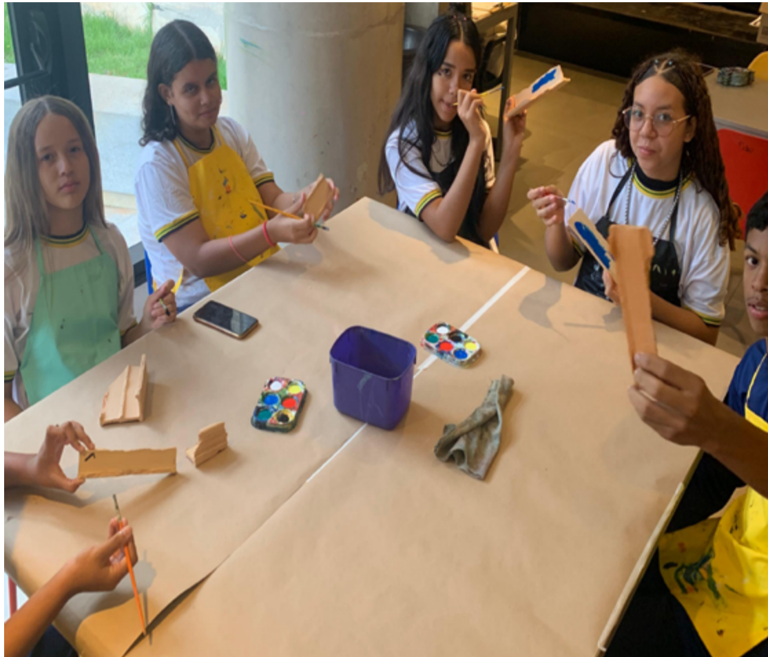
A turma uniu poesia e Cerrado em uma obra literária que expressa o aprendizado dos 38 alunos participantes da eletiva

A professora da área da Geografia está há quatro anos nesta escola e, desde que chegou na unidade, vem trabalhando eletivas voltadas à elaboração de poemas. Mas, recentemente, percebeu a urgência em discu-