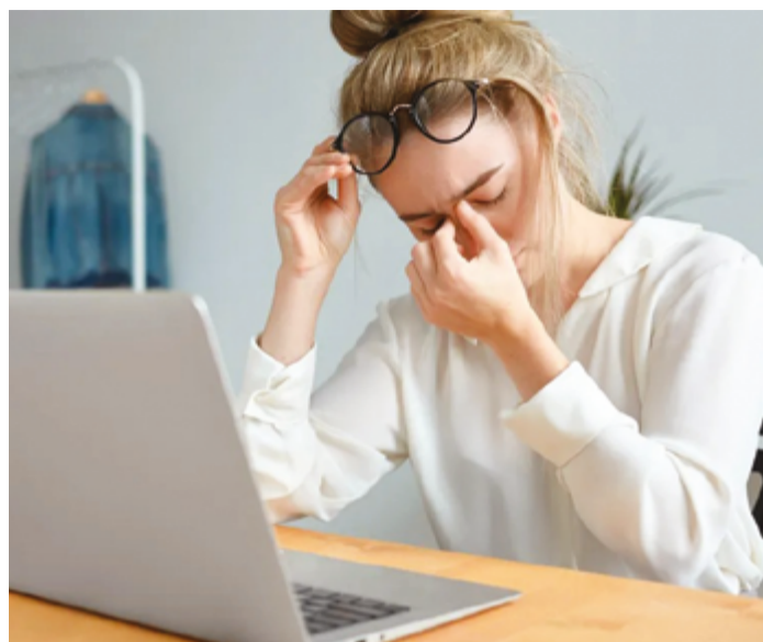
Muitas têm perda gradual da capacidade visual ao longo do tempo