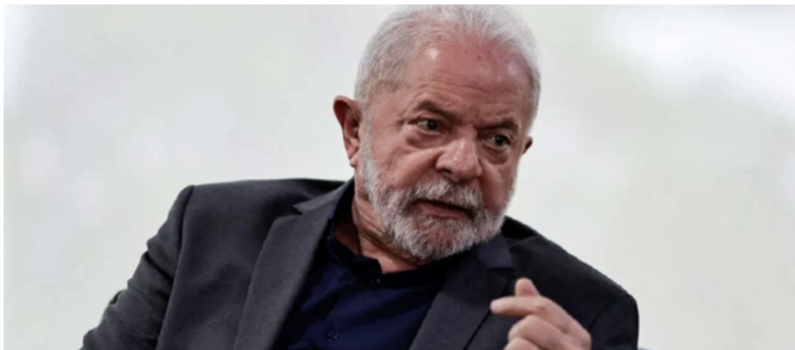
Lula da Silva: incentivar a produção de alimentos no país é um dever do governo

Durante o lançamento oficial do Plano Safra 24/25, para agricultura familiar, o presidente da República, Luiz Inácio Lula da Silva, destacou os esforços do Governo para constituição do novo Plano Agrícola e Pecuário. Foram destinados R$ 85,7 bilhões para a agricultura familiar, incremento de 10,3%, com R$ 76 bilhões, para o crédito rural do Programa Nacional de Fortalecimento da Agricultura Familiar (Pronaf).