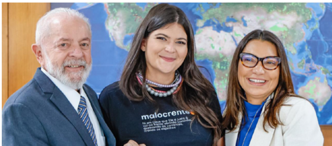
Lula da Silva, Aava Santiago e Janja da Silva: aproximação com evangélicos

O plano foi engavetado, mas isso não impediu que, de lá para cá, a vereadora ganhasse protagonismo em temas como defesa de direitos sociais, se tornando referência por ser uma ponte de diálogo entre a política e as igrejas. Enquanto isso, o governo federal segue patinando na aproximação com o segmento.