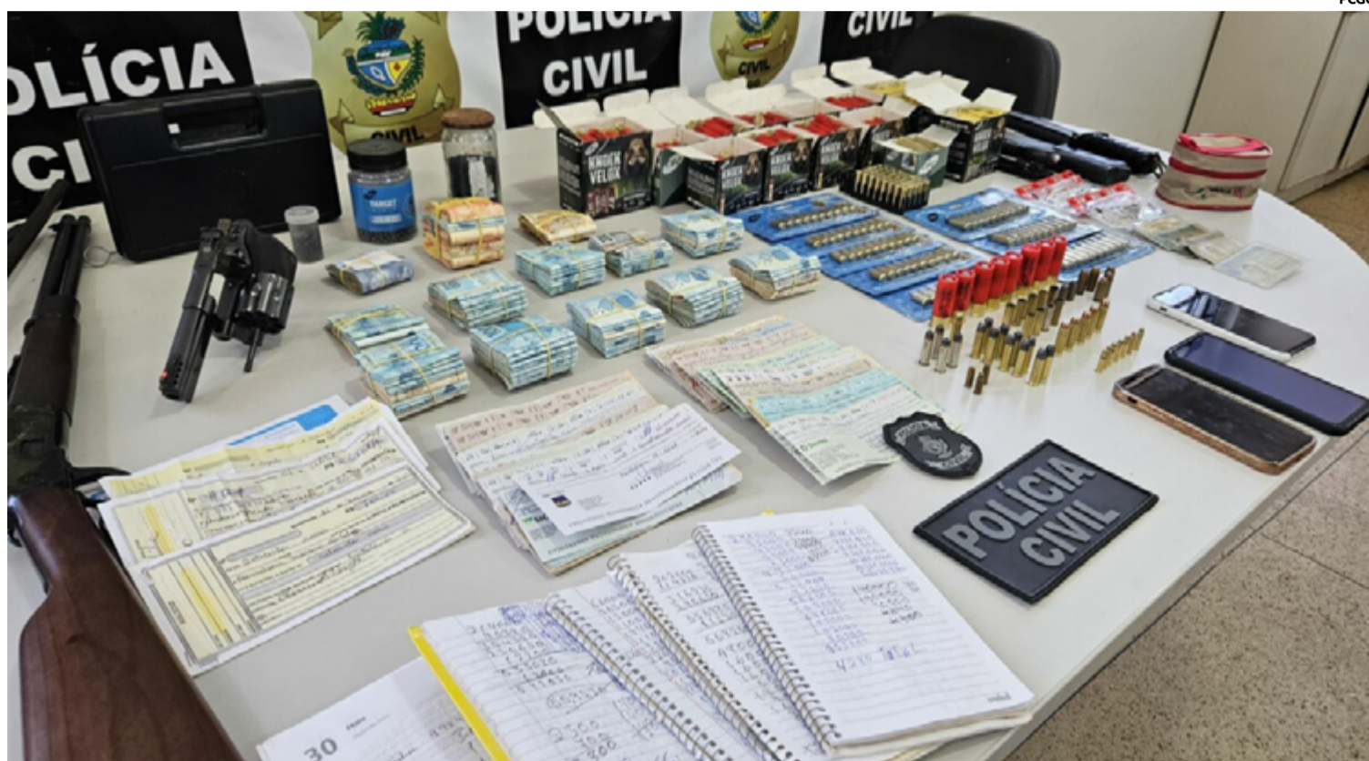
Durante a ação, os policiais civis encontraram e apreenderam quatro armas de fogo, incluindo armamentos de uso permitido e restrito, além de aproximadamente 500 munições

Um indivíduo foi preso em flagrante por posse irregular de armas de fogo e munições. Além do armamento, foram encontrados cerca de R$ 100 mil em dinheiro, diversos títulos de crédito com um valor total aproximado de R$ 1,5 milhão, joias e outros itens