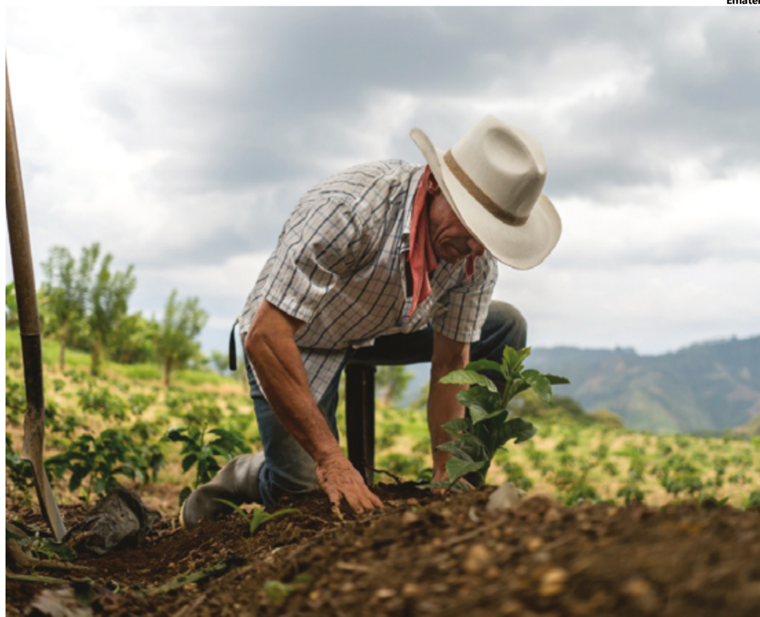
Supostos golpes financeiros, ora investigados, podem chegar a R$ 35 milhões contra produtores rurais

No entanto, muitas pessoas não sabem que têm essa possibilidade de correção da visão e como ela funciona. O estudo da SBO também revelou que 11% dos entrevistados nunca foram ao oftalmologista. Portanto, o primeiro passo para cuidar da saúde visual é sempre buscar um especialista.